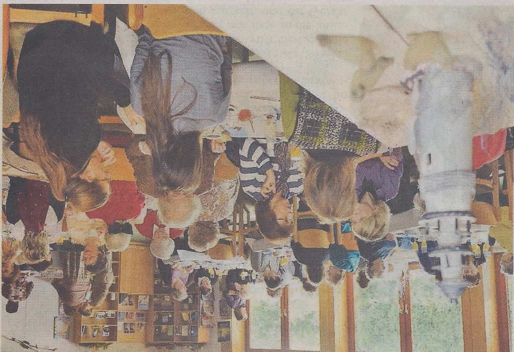
In der Peiner Stadtmission trafen sich etwa 50 Frauen zum gemütlichen Frühstück.

Capelle erklärte die Bedeutung und die Chancen von persönlichen Krisen – und auch die darin enthaltenen Herausforderungen. Aus eigener Erfahrung sprach sie „über die Revolution unserer Denksysteme und Glaubensmuster“. Sie stellte die Chancen heraus und zeigte den Zuhörern „die vergessenen Perlen“. Im Anschluss diskutierten die Besucherinnen angeregt über das Referat der Pastorin aus Hordorf bei Wolfenbüttel. Für die kleinen Gäste wurde parallel eine Kinderbetreuung angeboten – auch inklusive eines leckeren Frühstücks. tk